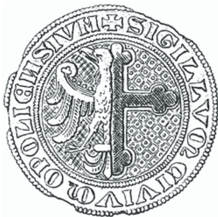
Il. 5. Pieczęć miejska Opola z XIII w.