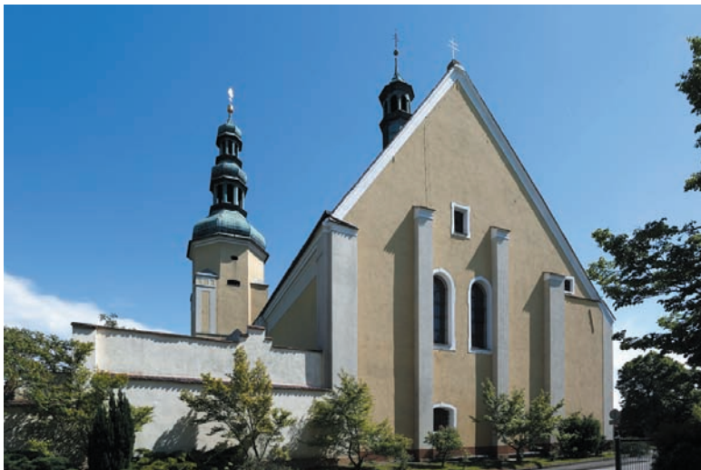
Il. 7. Klasztor norbertanek w Czarnowasch